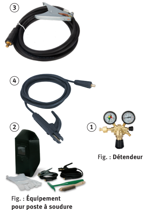
Fig. : Détendeur