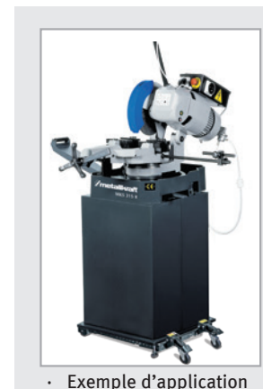
· Exemple d'application