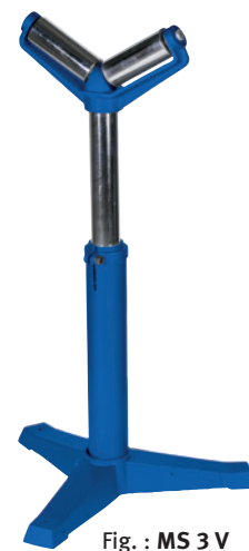
Fig. : MS 3 V