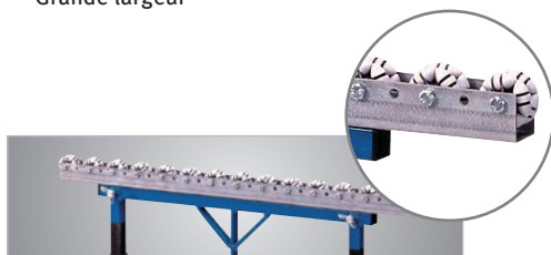
Fig. : MS 4 R