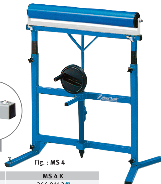
Fig. : MS 4