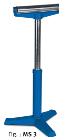
Fig. : MS 3