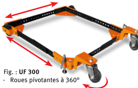
Fig. : UF 300 · Roues pivotantes à 360°