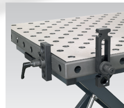
• Exemple d'application