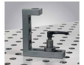
• Exemple d'application