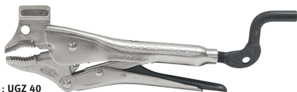
Fig. : UGZ 40