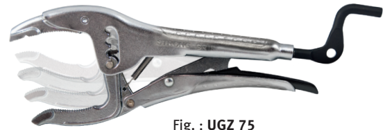
Fig. : UGZ 75