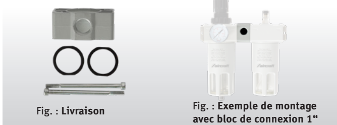
Fig. : Livraison