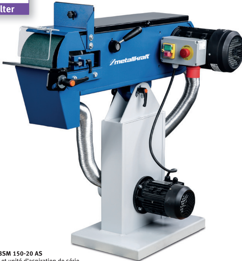
Fig. : MBSM 150-20 AS · Socle et unité d'aspiration de série