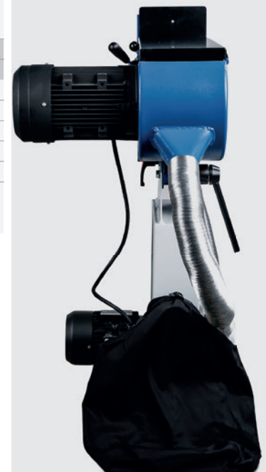
Fig. : MBSM ISO-20AS vu arrière