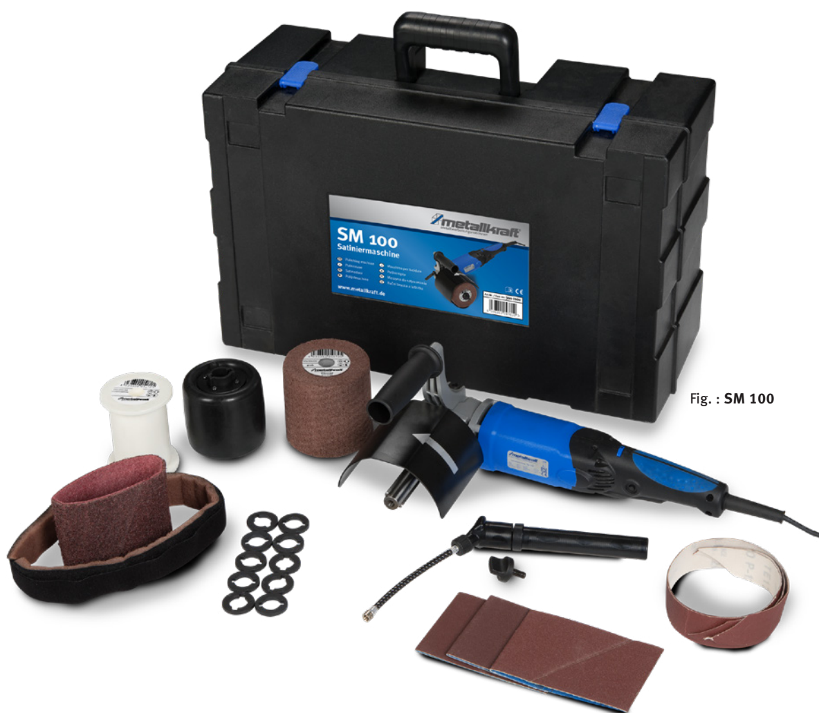
Fig. : SM 100