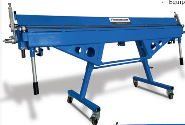
Fig. : HSBM 2160-1,0 · Avec accessoires optionnels