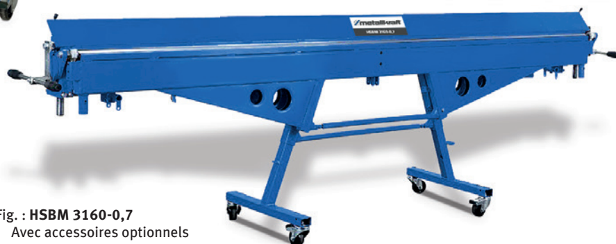
Fig. : HSBM 3160-0,7 · Avec accessoires optionnels