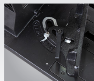
• Réglage de l'angle 0° à 45° pour les coupes d'onglet