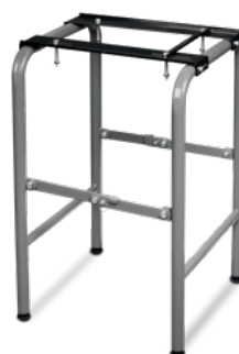
Fig. : Socle MUG 1