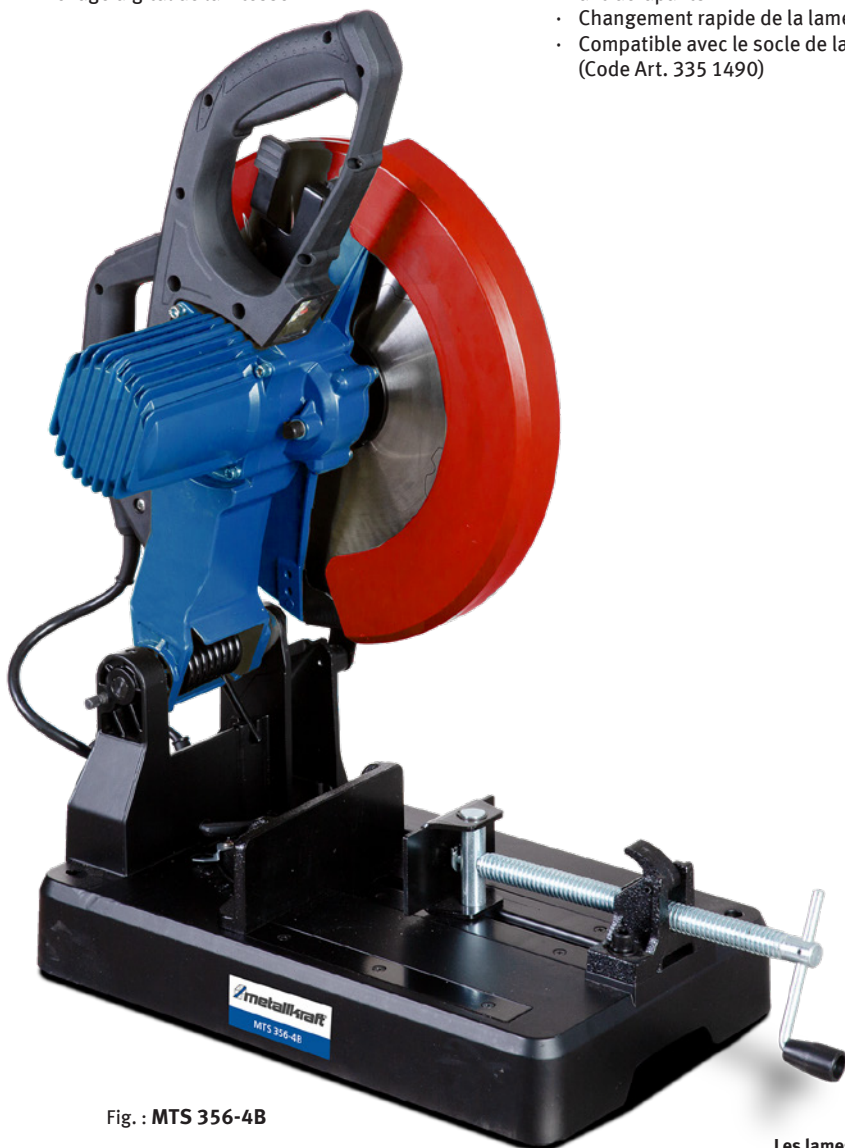
Fig. : MTS 356-4B