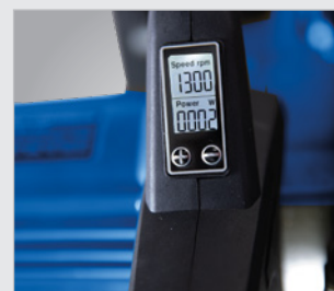
• Affichage digital de la vitesse de lame