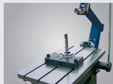
• Bras support d'outils • Peut être basculé vers l'arrière en ouvrant le levier de serrage • Pour un changement aisé des pièces et de l'outil