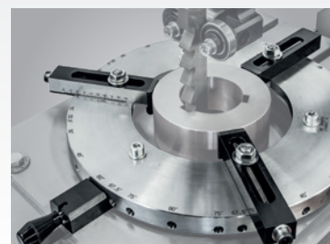
• Plateau diviseur gradué