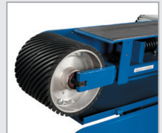
· Roues d'entraînement de grandes dimensions (Fig. : MBSM 150-200-2)