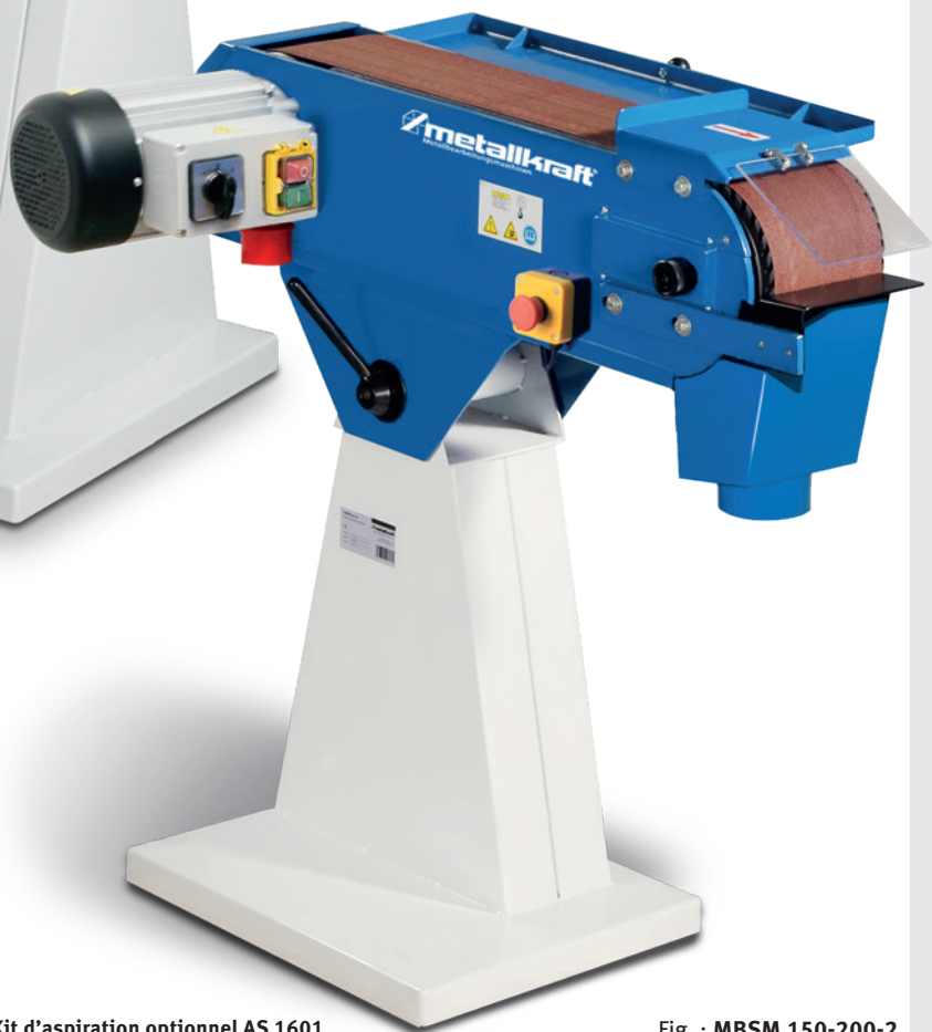
Fig. : MBSM 150-200-2 · Socle de série