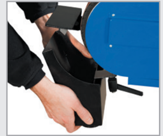
· Boîte à copeaux, facilement amovible (Fig. : MBSM 150-200-2)