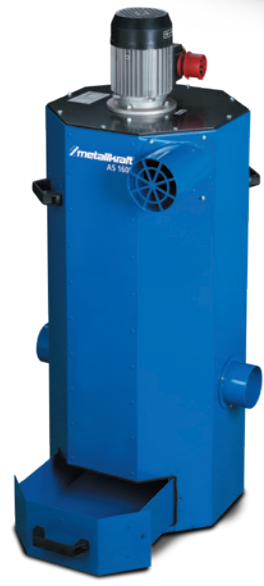
Kit d'aspiration optionnel AS 1601 pour MBSM 75-200-1, MBSM 75-200-2 et MBSM 150-200-2 (plus de détails voir page 613) Code article 392 2006 4