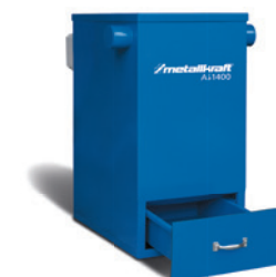
Kit d'aspiration optionnel AS 1400 pour MBSM 100-140-1 et MBSM 100-140-2 (plus de détails voir page 521) Code article 392 2011

Modèles en 400 V 2 vitesses de défilement pour un usinage parfaitement adapté à la matière