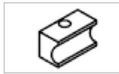
• Contre forme coulissante