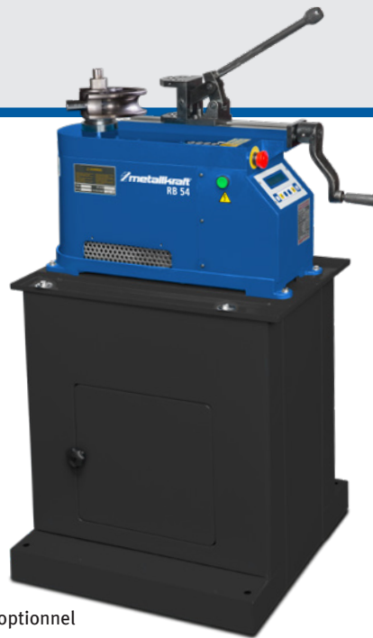
Fig. : RB 54 • Avec socle optionnel