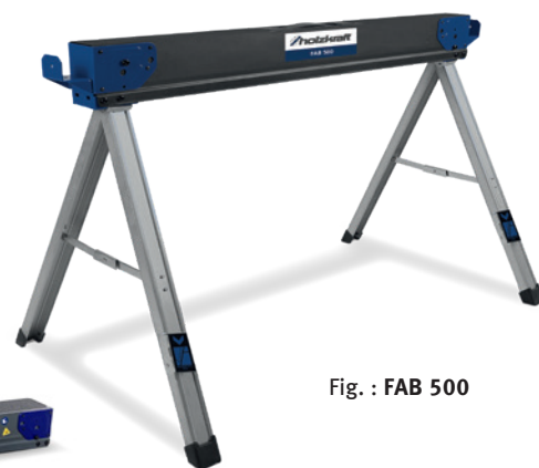
Fig. : FAB 500