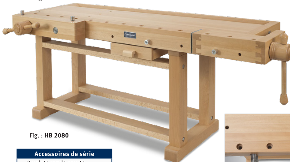
Fig. : HB 2080