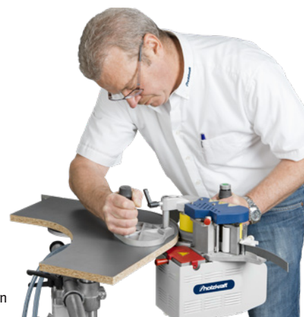
Fig. : KAG 4 SET • Exemple d'application