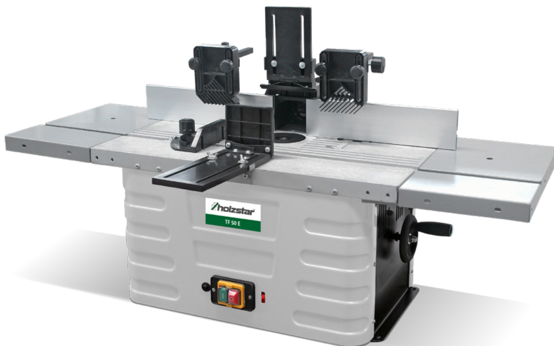
Fig. : TF 50 E