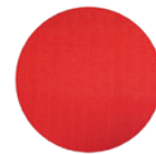
Fig. : Support Velcro · En option