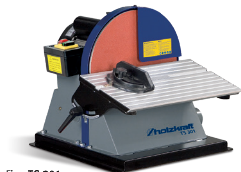
Fig.: TS 301