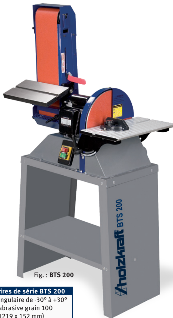
Fig. : BTS 200