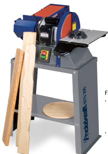
Fig.: BTS 200