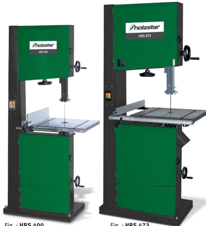
Fig. : HBS 400