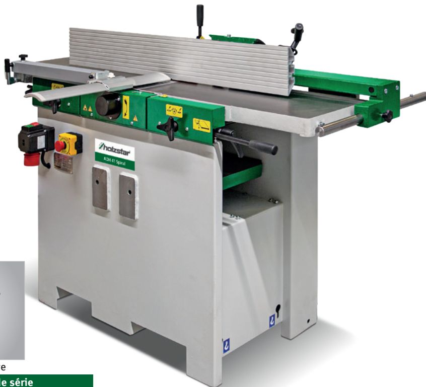
Fig. : ADH 41 Spiral