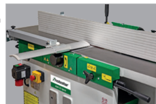
Table de dégauchissage