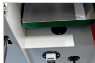
Table de rabotage