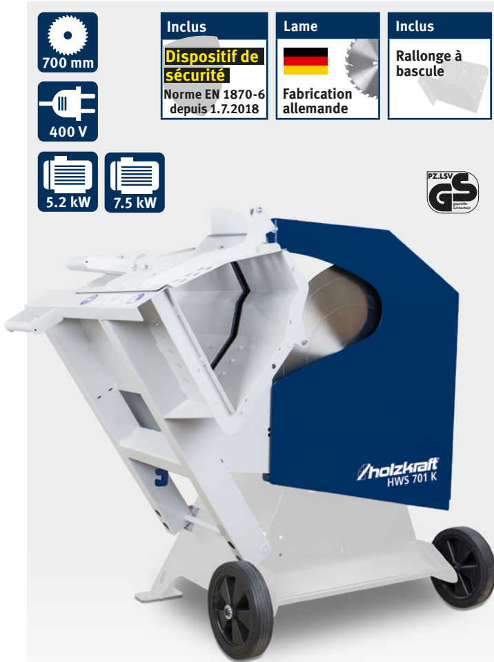
Fig. : HWS 701 K