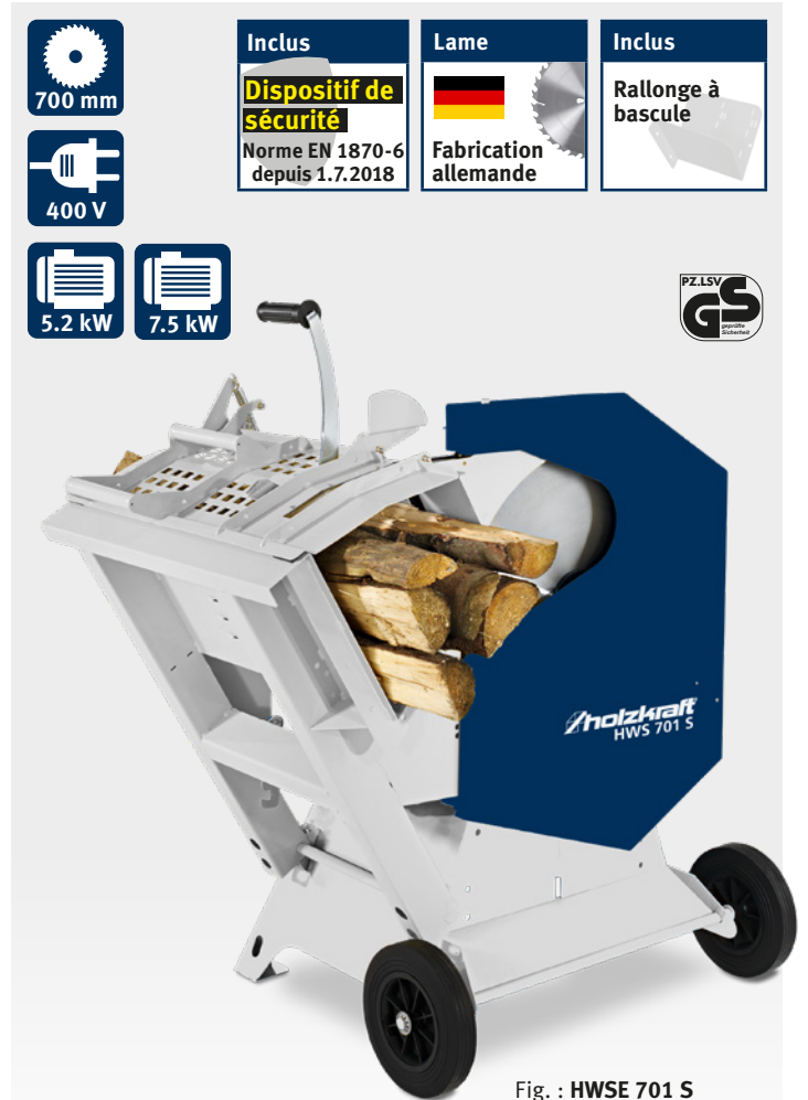
Fig. : HWS 701 S