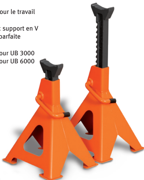
Fig. : Série UB