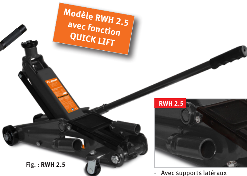
Fig. : RWH 2.5