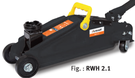
Fig. : RWH 2.1