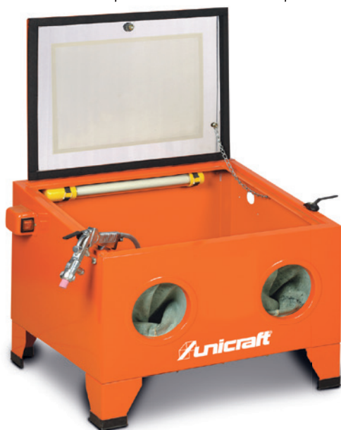
Fig. : SSK 1