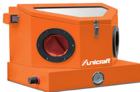
Fig. : SSK 1.5