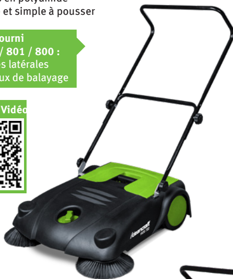
Fig. : HKM 700