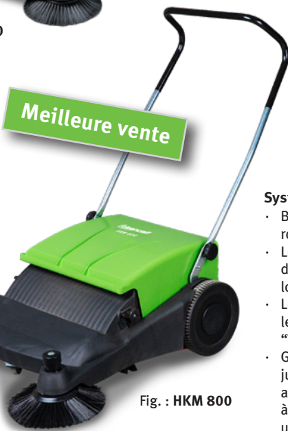
Fig. : HKM 800