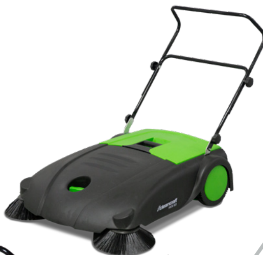
Fig. : HKM 801