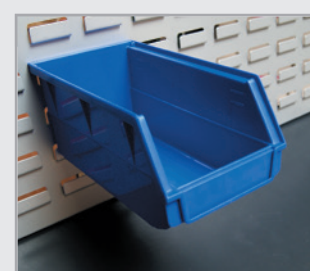
· Bac à bec sur panneau cranté