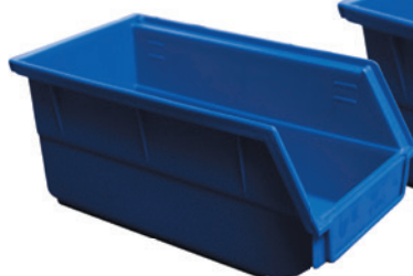
Fig. : Bac profondeur 190 mm