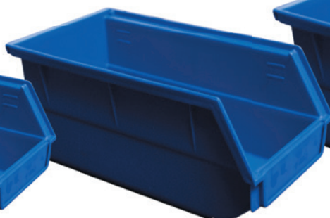
Fig. : Bac profondeur 220 mm