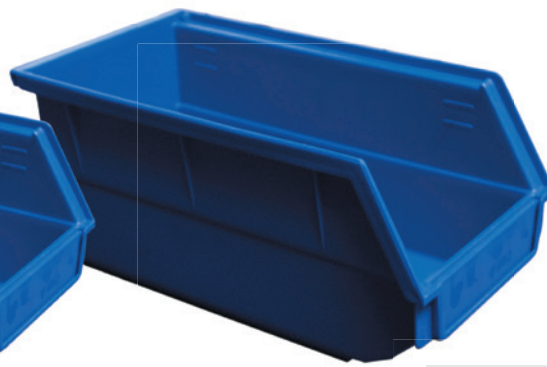
Fig. : Bac profondeur 270 mm