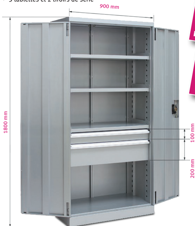
Fig. : Armoire