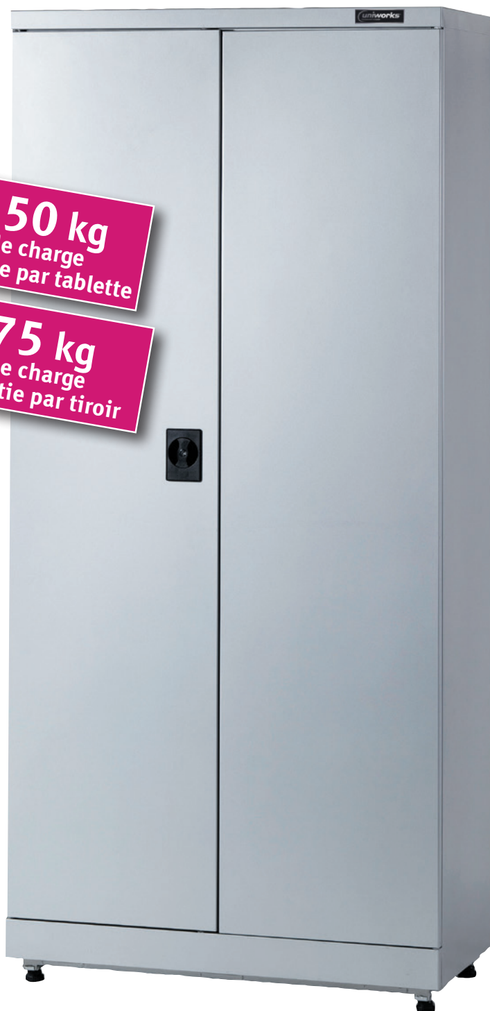
Fig. : Armoire avec base réglable en option